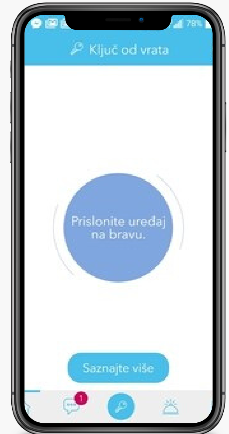
Primjer integracije sa aplikacijom klijenta